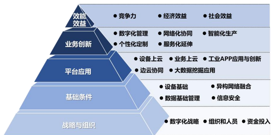
图 1 工业互联网平台应用水平与绩效评价框架

e) 效能效益： 主要评价企业应用工业互联网平台的效能效益，包括竞争力、经济效益和社会效益三个方面。